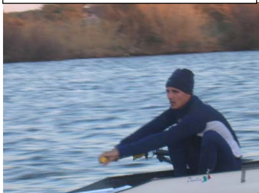
Vento e onde.....anche a Sabaudia!