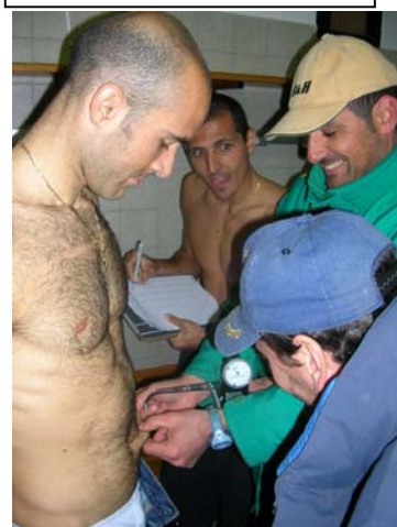
Il prelievo del grasso!!!

barca, viaggio, vitto ed alloggio nonchè gommone per farci seguire dal nostro tecnico.