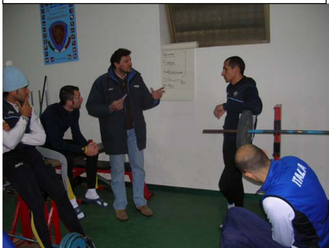
In riunione con il nostro Coach

Insomma nell'insieme non possiamo proprio lamentarci, come in una buona squadra, ognuno sta facendo la sua parte. Unica nota dolente rimane il peso ed ogni buon PL sa di cosa parlo, si è scesi molto progressivamente è questo secondo tutti è un buon punto a nostro favore, ma non per questo